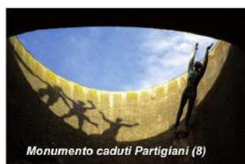
Monumento caduti Partigiani (8)