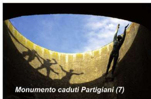
Monumento caduti Partigiani (7)

Il cimitero fu inaugurato con l'intenzione di farne il luogo dove esaltare il contributo dei cittadini rispetto alle glorie dinastiche e familiari. In tale direzione è la costruzione nel 1828 del Pantheon dei bolognesi illustri , ora spazio adibito a Sala del Commiato o per altre funzioni religiose, integrato nel 2008 con l'allestimento dell'artista Flavio Favelli.