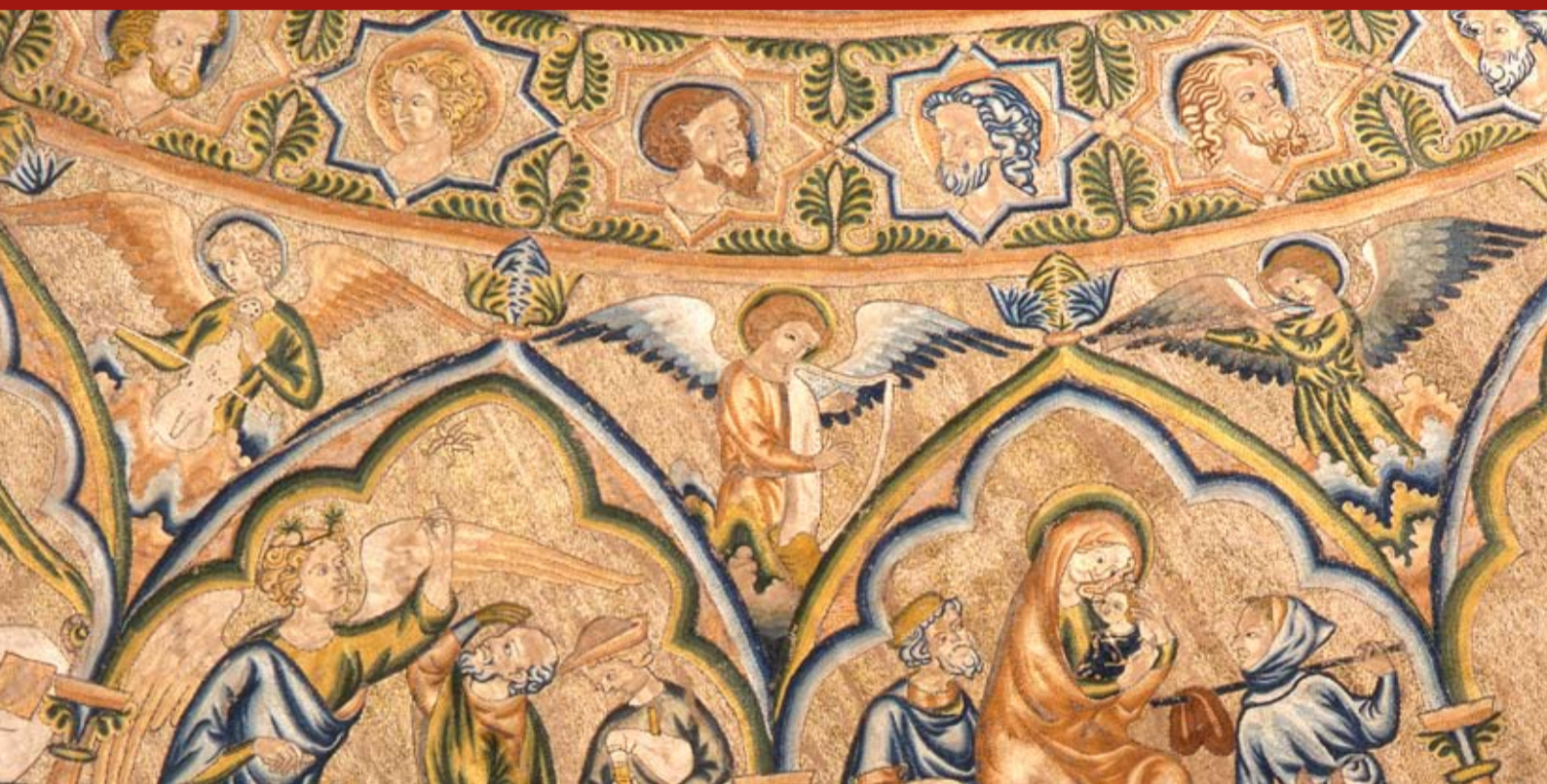
Manifattura inglese | Piviale con scene della vita di Cristo | Ricamo, fine XIII - inizio XIV secolo, Museo Civico Medievale

Prosegue la consueta e variegata offerta culturale, che i Musei Civici d'Arte Antica di Bologna propongono ormai da alcuni anni.