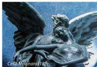
Cello Magnani (18)

Al termine del XIX secolo i chiostri e le sale che ruotano attorno al grandioso Chiostro VI assumono un aspetto di maggiore ricchezza e lusso rispetto all'area più antica. Passeggiando è possibile ammirare il mutare del gusto dal Verismo al Liberty, fino al rinnovato fervore classicista degli anni del Ventennio. Le Celle Albertoni (25) e Magnani (18) sono tra i migliori esempi del Liberty italiano.