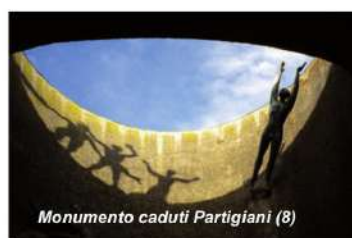
Monumento caduti Partigiani (8)