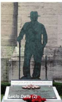
Lucio Dalla (2)