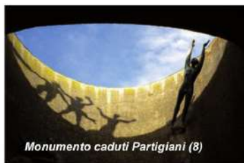
Monumento caduti Partigiani (8)