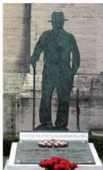
Lucio Dalla (2)

Nel cimitero sono ospitate alcune figure importanti per la storia locale e nazionale, tra cui lo statista Marco Minghetti (29); i pittori Giorgio Morandi (5) e Bruno Saetti (6); il premio Nobel per la letteratura Giosue Carducci (1) e lo scrittore Riccardo Bacchelli (8); il cantante d'opera Carlo Broschi detto Farinelli (26), il compositore Ottorino Respighi (3) e il cantante Lucio Dalla (2); i fondatori delle aziende Maserati (17) e Ducati (30) e della casa editrice Zanichelli.