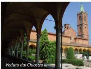
View from Chiostro III

La chiesa di S. Girolamo è testimonianza della ricchezza perduta del monastero. Alle pareti grande ciclo di dipinti dedicati alla vita di Cristo della metà del XVII secolo.