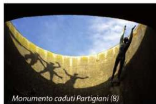
Monumento caduti Partigiani (8)

Al centro del Campo degli Ospedali si trova uno dei migliori esempi del Razionalismo architettonico di metà '900: il Monumento Ossario dei caduti Partigiani (8). Progettato dal milanese Piero Bottoni, per cui vi esegue anche uno dei gruppi scultorei, vede il suo ideale completamente con la collocazione davanti all'ingresso del sarcofago di Giuseppe Dozza, il Sindaco della Liberazione.