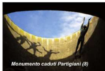
Monumento caduti Partigiani (8)

Al centro del Campo degli Ospedali si trova uno dei migliori esempi del Razionalismo architettonico di metà '900: il Monumento Ossario dei caduti Partigiani (8). Progettato dal milanese Piero Bottoni, per cui vi esegue anche uno dei gruppi scultorei, vede il suo ideale completamente con la collocazione davanti all'ingresso del sarcofago di Giuseppe Dozza, il Sindaco della Liberazione.