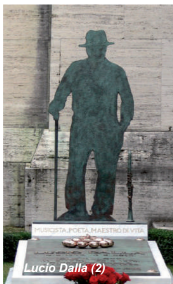
Lucio Dalla (2)