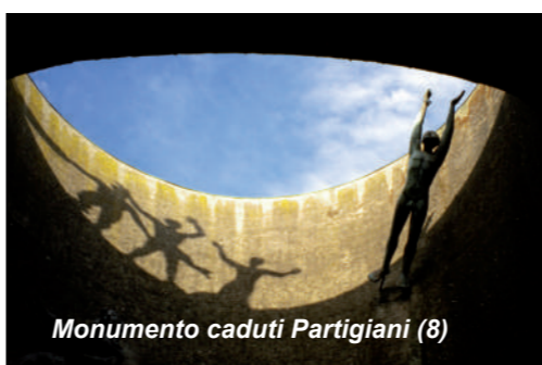
Monumento caduti Partigiani (8)