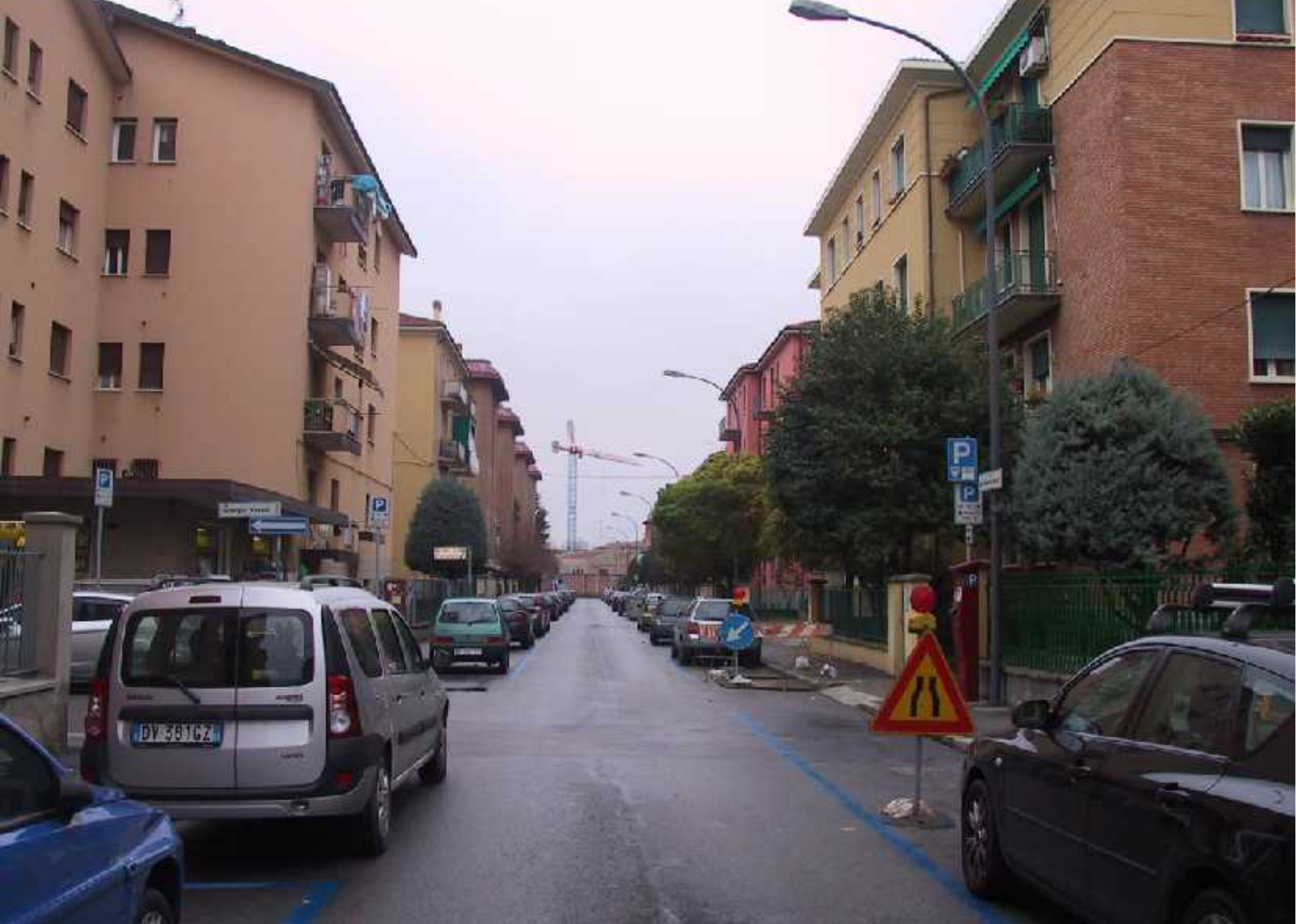
Vista da via Fornasini