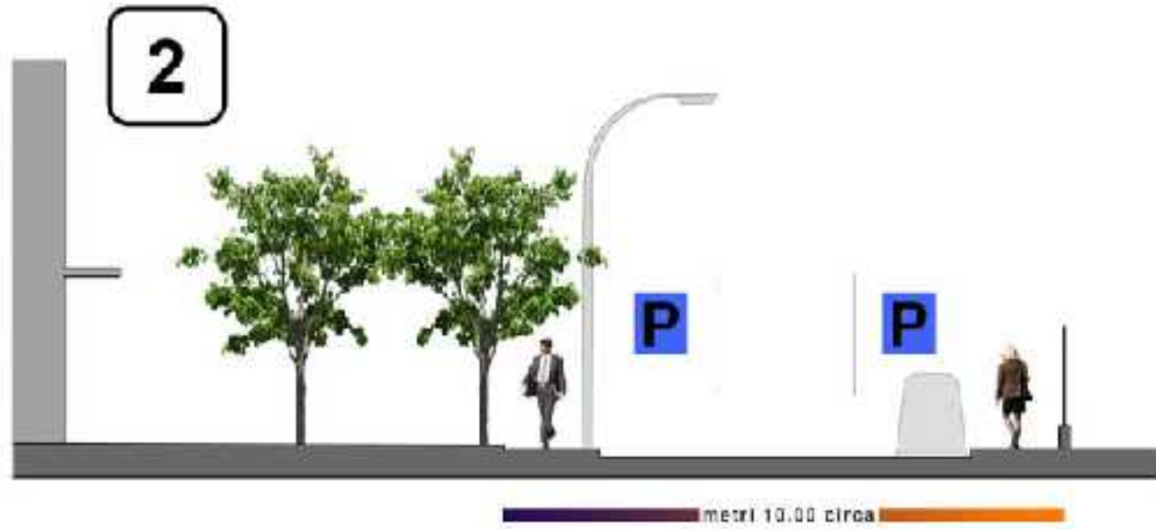
Sezioni attuali via Passarotti