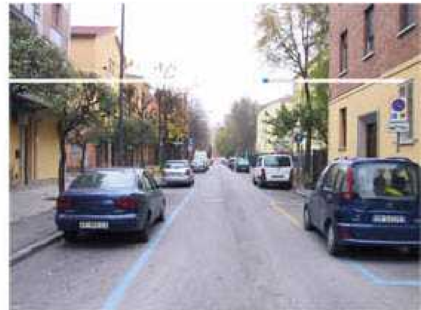
Sezioni attuali via Passarotti