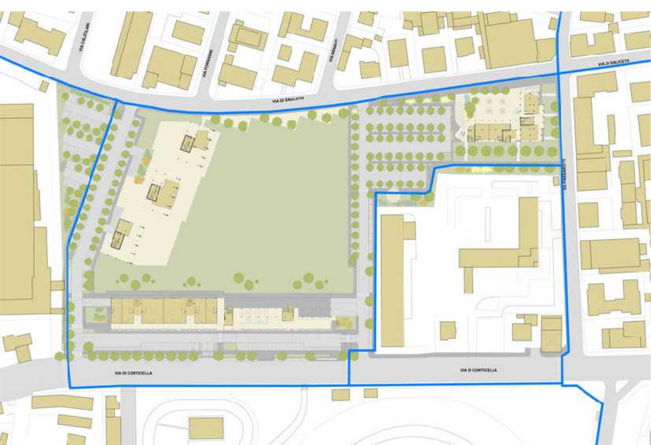
Schema dei collegamenti ciclabili