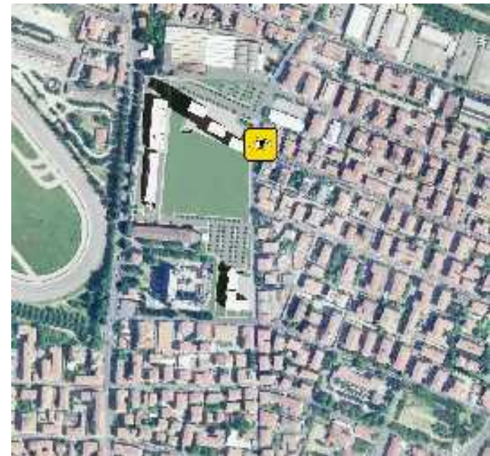
Via di Saliceto