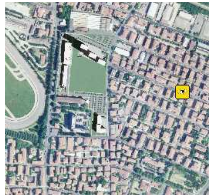
Vista da via Fornasini