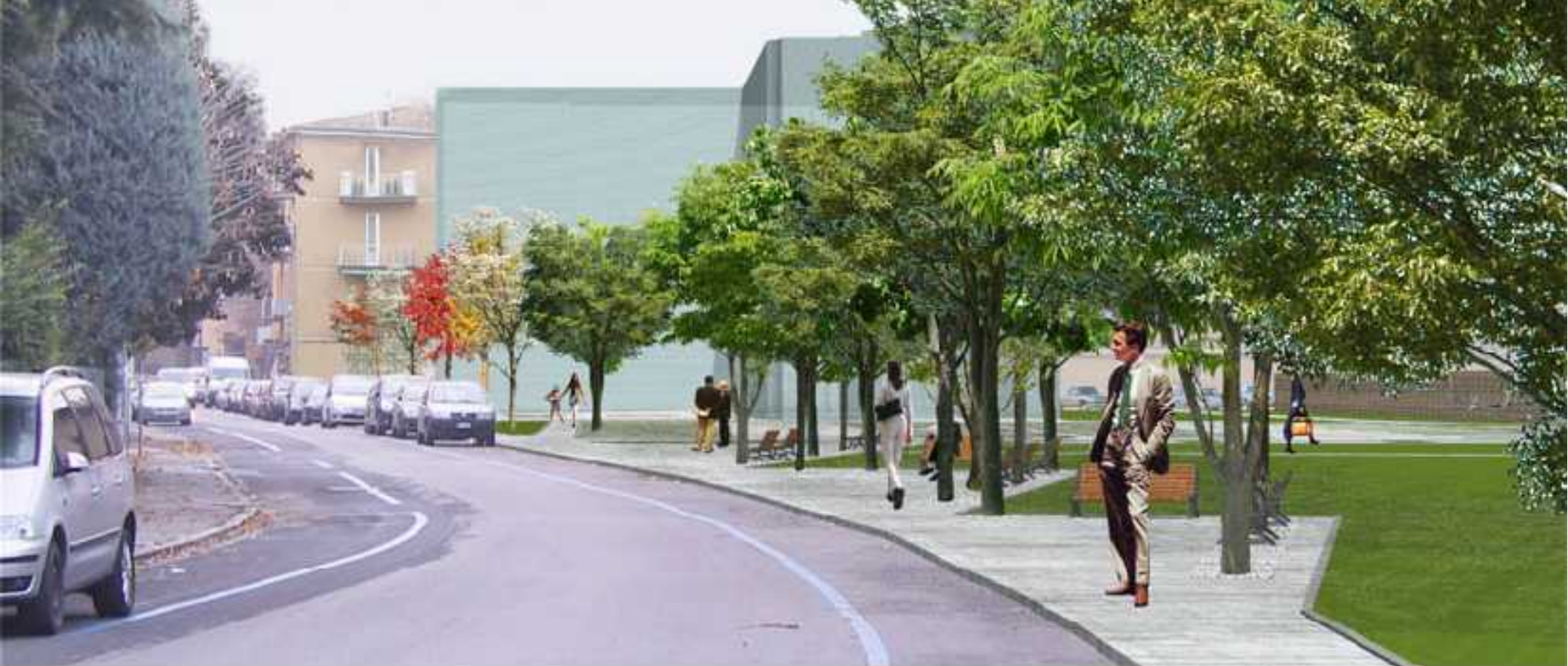
Via di Saliceto