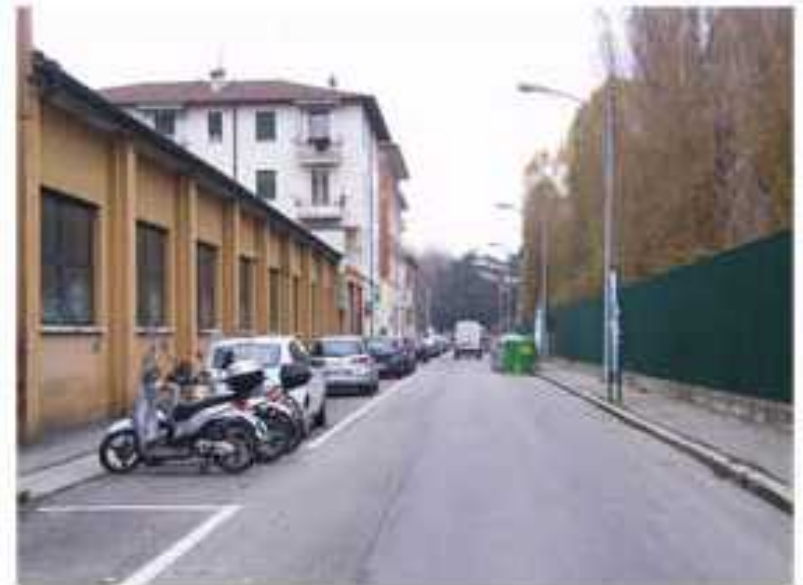
Sezioni attuali via Passarotti