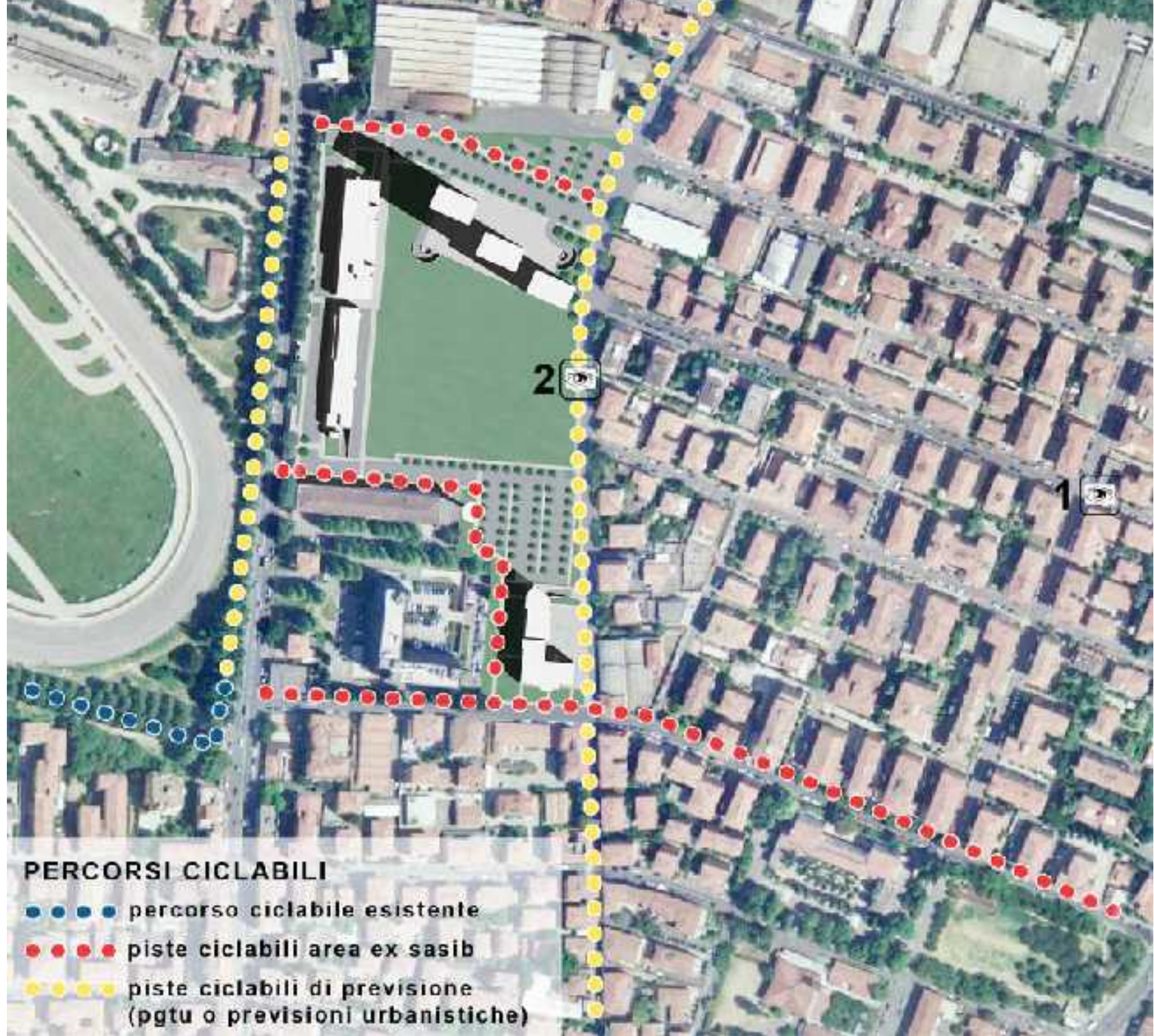
Previsioni ciclabili dell'area