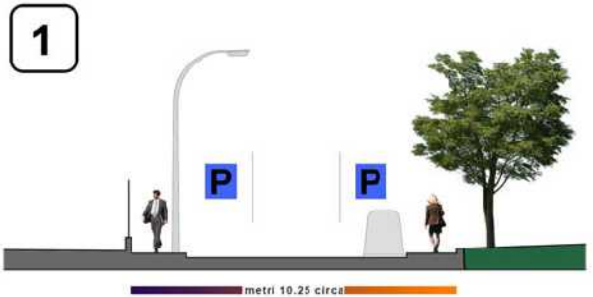
Sezioni attuali via Passarotti