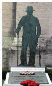
Lucio Dalla (2)

La Certosa è stata per tutto l'Ottocento meta del visitatore a Bologna. Lord Byron, Charles Dickens e Sigmund Freud hanno lasciato traccia scritta della loro visita nel cimitero.