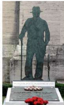
Lucio Dalla (2)