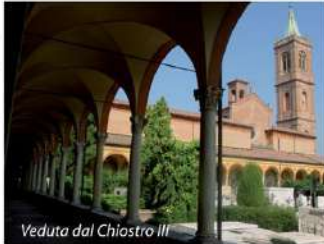
View from Chiostro III

La Certosa è stata per tutto l'Ottocento meta del visitatore a Bologna. Lord Byron, Charles Dickens e Sigmund Freud hanno lasciato traccia scritta della loro visita nel cimitero.