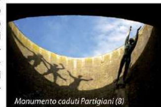
Monumento caduti Partigiani (8)

Al centro del Campo degli Ospedali si trova uno dei migliori esempi del Razionalismo architettonico di metà '900: il Monumento Ossario dei caduti Partigiani (8). Progettato dal milanese Piero Bottoni, per cui vi esegue anche uno dei gruppi scultorei, vede il suo ideale completamente con la collocazione davanti all'ingresso del sarcofago di Giuseppe Dozza, il Sindaco della Liberazione.