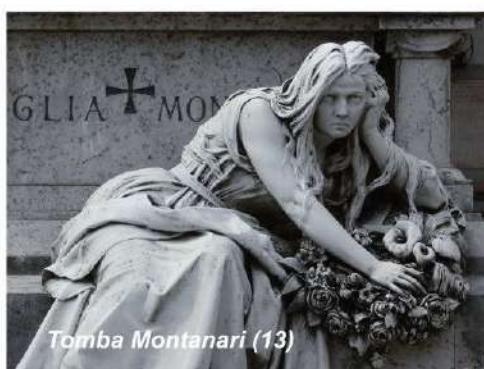
Tomba Montanari (13)