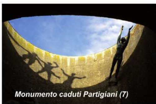
Monumento caduti Partigiani (7)

Al centro del Campo degli Ospedali si trova uno dei migliori esempi del Razionalismo architettonico di metà '900: il Monumento Ossario dei caduti Partigiani (7). Progettato dal milanese Piero Bottoni, per cui vi esegue anche uno dei gruppi scultorei, vede il suo ideale completamente con la collocazione davanti all'ingresso del sarcofago di Giuseppe Dozza, il Sindaco della Liberazione.