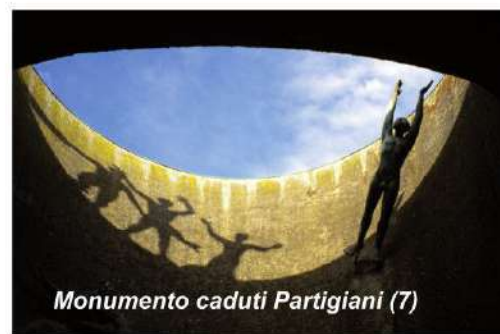
Monumento caduti Partigiani (7)

Il cimitero fu inaugurato con l'intenzione di farne il luogo dove esaltare il contributo dei cittadini rispetto alle glorie dinastiche e familiari. In tale direzione è la costruzione nel 1828 del Pantheon dei bolognesi illustri , ora spazio adibito a Sala del Commiato o per altre funzioni religiose, integrato nel 2008 con l'allestimento dell'artista Flavio Favelli.