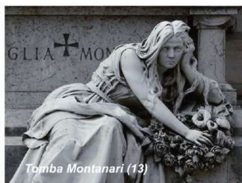
Tomba Montanari (13)