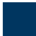
BLU TRAFFICO RAL 5017