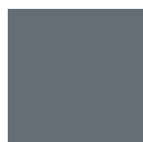
GRIGIO SCURO FERROMICACEO RAL 7011