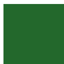
VERDE SCURO RAL 6005