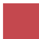
ROSSO SCURO RAL 3001