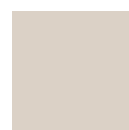
GRIGIO AVORIO RAL 1013