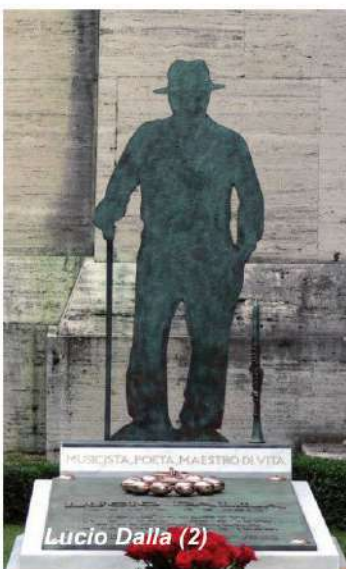
Lucio Dalla (2)