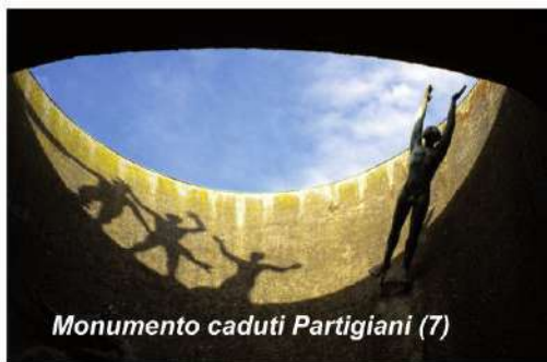
Monumento caduti Partigiani (7)

Il cimitero fu inaugurato con l'intenzione di farne il luogo dove esaltare il contributo dei cittadini rispetto alle glorie dinastiche e familiari. In tale direzione è la costruzione nel 1828 del Pantheon dei bolognesi illustri , ora spazio adibito a Sala del Commiato o per altre funzioni religiose, integrato nel 2008 con l'allestimento dell'artista Flavio Favelli.